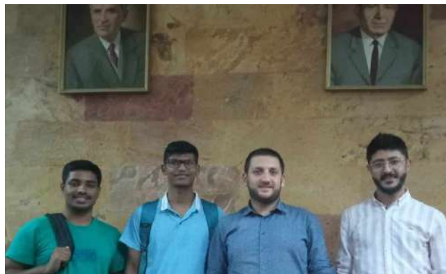
ԱԲՀ ուսանողները՝ ԱԲՀ Գիտական մասի վարիչի հետ միասին՝ BIO-SEE գիտական սեմինարին, Երևան: