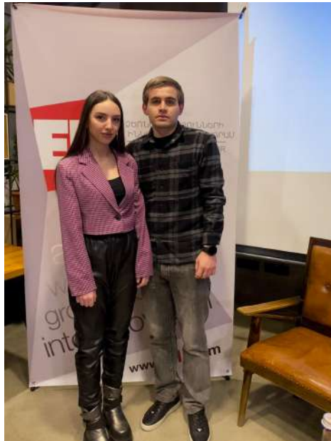
ԱԲՅ ուսանողները՝ ՁԻՅ կողմից կազմակերպված “Գիտության շարժիչ ուժի” գիտական միջոցառմանը