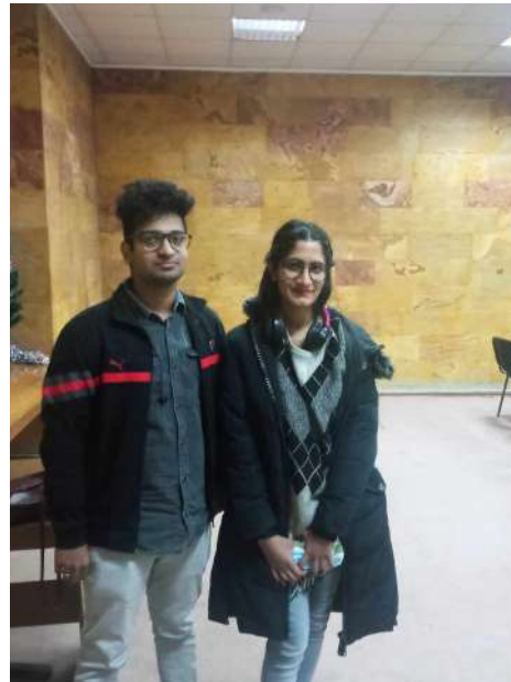
ԱԲՅ ուսանողները՝ Լ.Ա.Օրբելու անվան Ֆիզիոլոգիայի ինստիտուտում գիտաժողովի մասնակցելիս