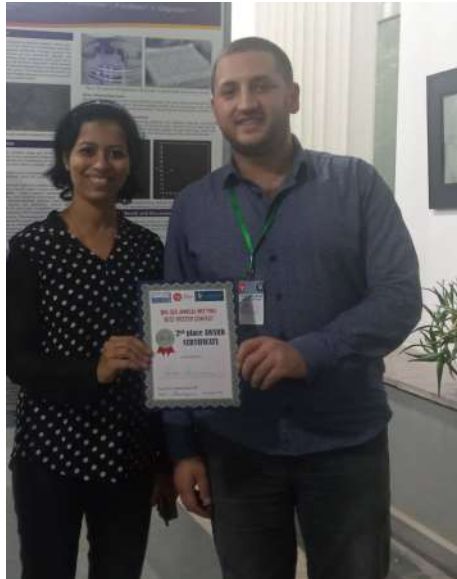
Պաստառային զեկույցն արժանացել է 2-րդ հորիզոնականի Bio-SEE Կենսապատկերման միջազգային գիտաժողովին, Երևան: