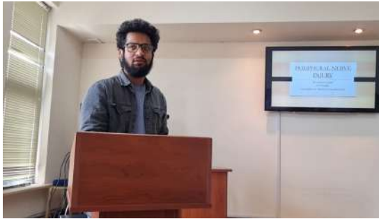
ԱնջանԿումար Պ.Վ.-ի զեկույցն իր աշխատանքների մասին՝ ԱԲՀ ուսանողական գիտաժողովին