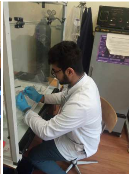
ԱնջանԿումար Պ.Վ.-ի մասնակցությունը փորձարարական աշխատանքներին