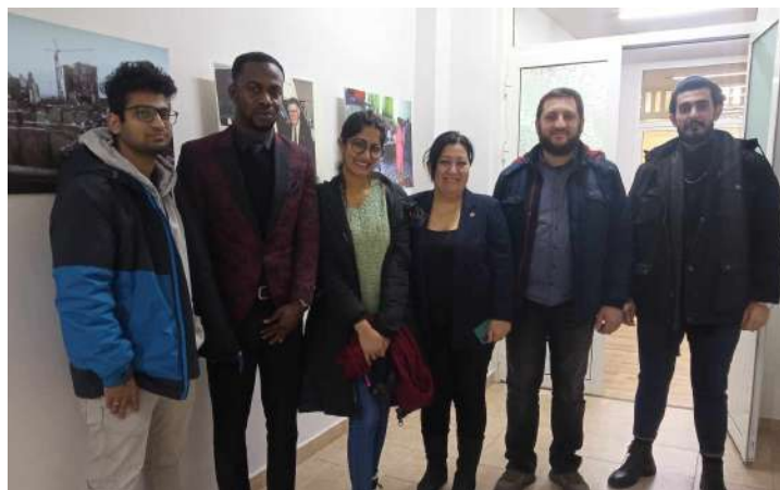
ԱԲՀ ուսանողների / ՈՒԳԸ անդամների այցելությունը Չայկական Կարմիր խաչի ընկերություն